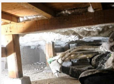
床下断熱 発砲ウレタン吹付工法