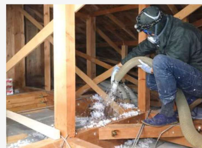
天井断熱 小屋裏ブローイング工法